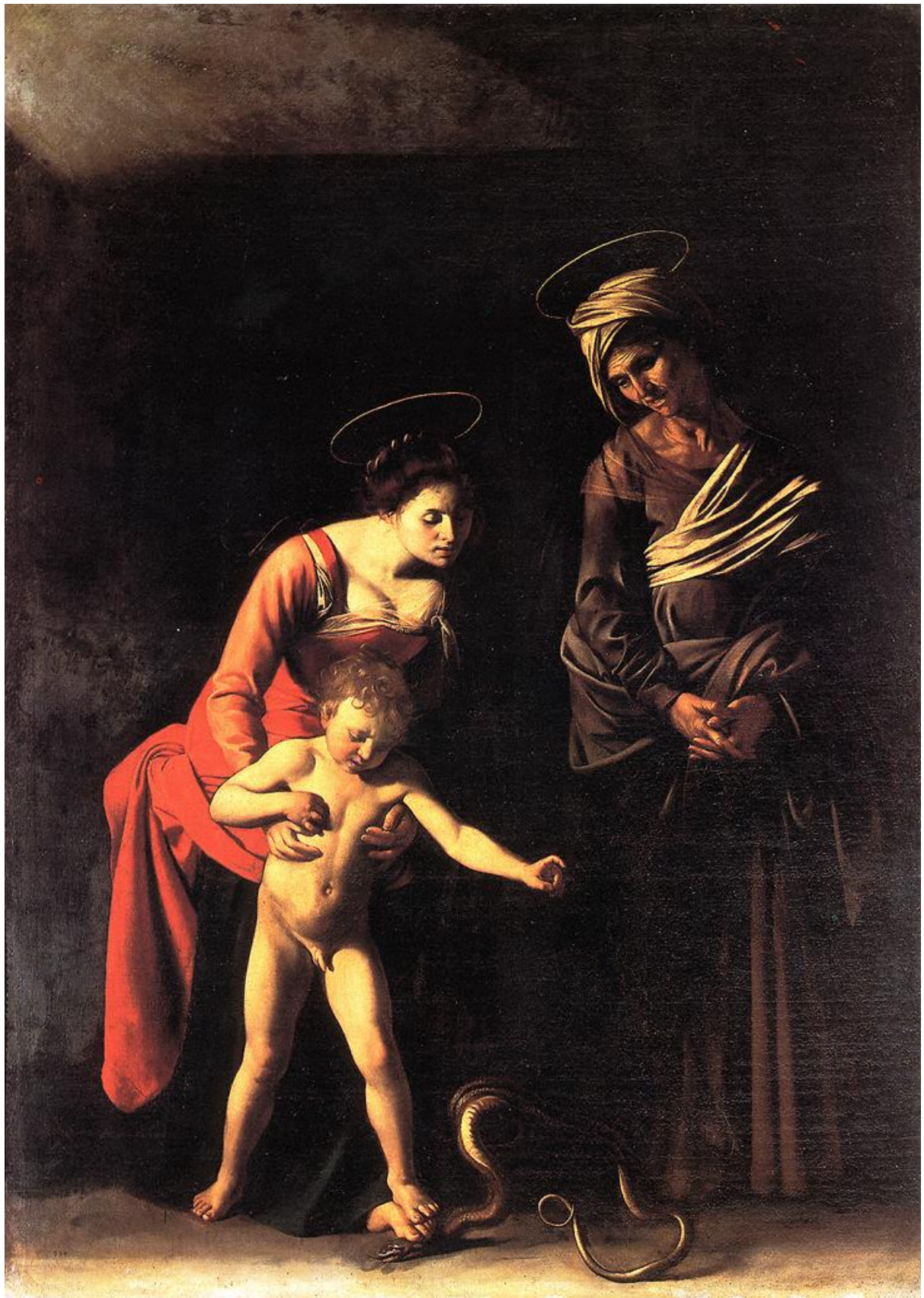
IL CARAVAGGIO – Madonna Palafrenieri (Madonna con la serpente) – 1606, Galleria Borghese , Roma