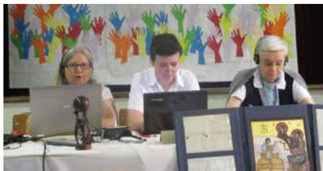
Comisión de redacción

Los días 28 y 29 de julio, las capitulares entrarán en un tiempo de oración y discernimiento para la elección de la Superiora general y sus consejeras.