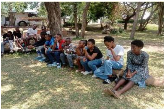
Picnic de los Faustinos de Zambia