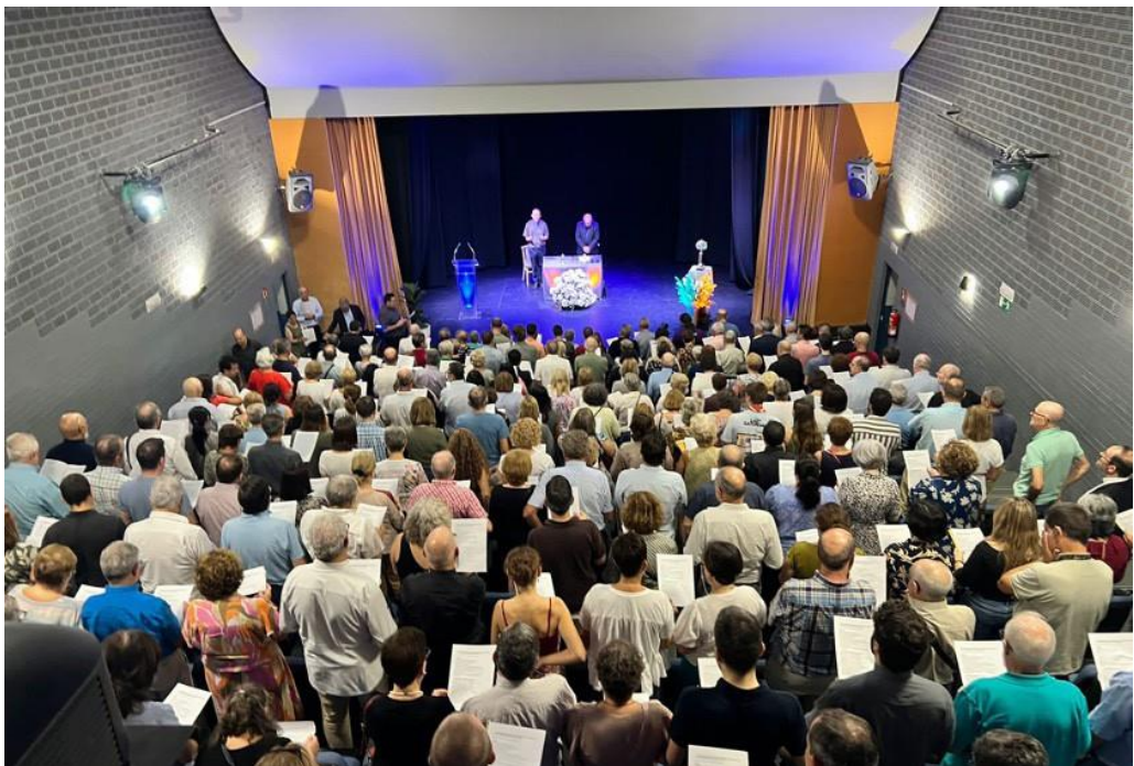
Salón de actos del Colegio del Pilar de Valencia (España). Foto de la asamblea.