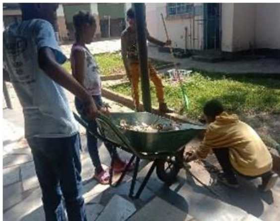
Jóvenes del Grupo Faustino de Zambia realizando trabajos de servicio comunitario.