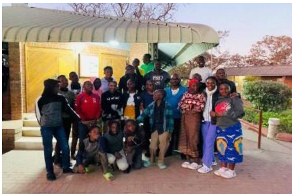
Miembros del Grupo Faustino que asistieron a la Adoración