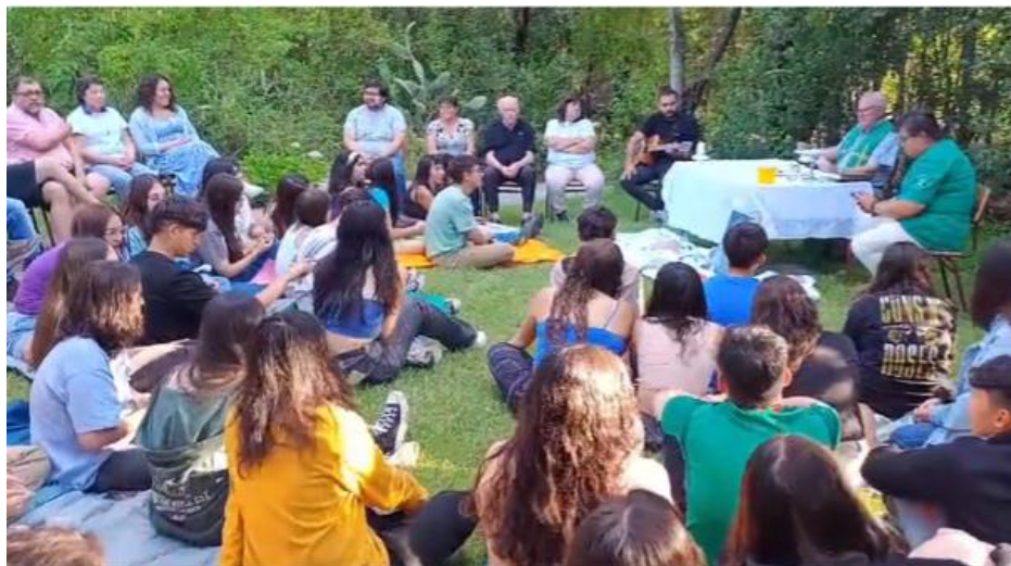
Misa de campaña celebrada durante el campamento de verano del Movimiento Faustino el pasado mes de enero; con representación de las cuatro ramas de la Familia Marianista, presentes en Chile.