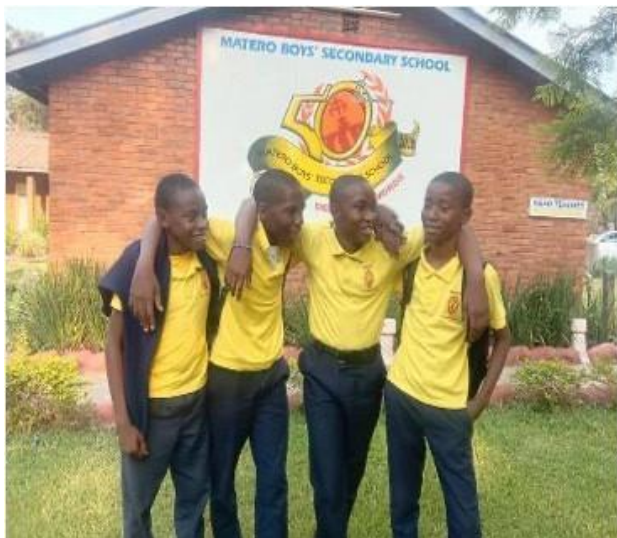
Alumnos del colegio marianista St. Joseph Chapel de Matero, miembros del Grupo Faustino del centro.

El movimiento FAUSTINO funciona en Lusaka (Zambia) desde hace unos años. Tiene una gran fuerza, no solo en relación a sus miembros sino también en las acciones de servicio que llevan a cabo.