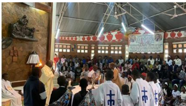
Celebración de la eucaristía comunitaria de los Faustinos.