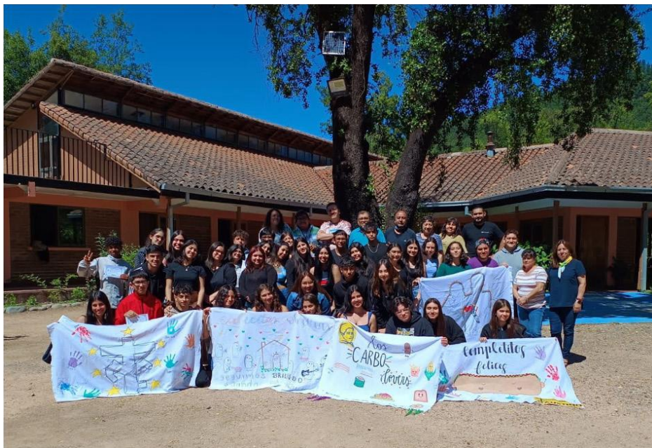
Foto de grupo de los asistentes al campamento del Movimiento Faustino de Chile, enero 2024.