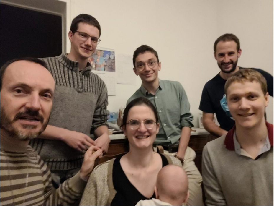
Miembros de la Fraternidad Faustino

A raíz de las actividades de pastoral juvenil en el liceo y de los campamentos de JFM (Joven Familia Marianista), sobre todo en Valencia en 2013, creamos una fraternidad marianista llamada Faustino.